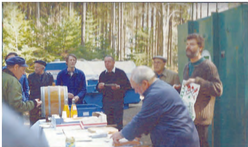
Inauguration de la déchetterie de Peney-Le-Jorat en mars 1990.

Première déchetterie du canton de Vaud, celle de Peney-Le-Jorat en mars 1990 !